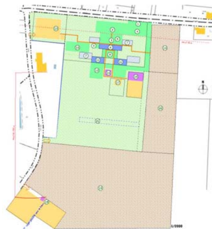
Programme de l'Ecopôle

Le projet s'appuie sur un partenariat public-privé fort, entre la Communauté de Communes de Montaigne en Montravel, maître d'ouvrage, et l'association Ecopôle, regroupant une vingtaine de chefs d'entreprises.