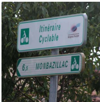
signalétique des pistes cyclables

Le balisage oriente les usagers deux-roues vers ces