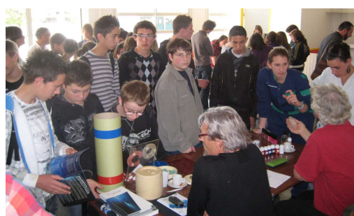
Métiers chimie et procédés - 2010