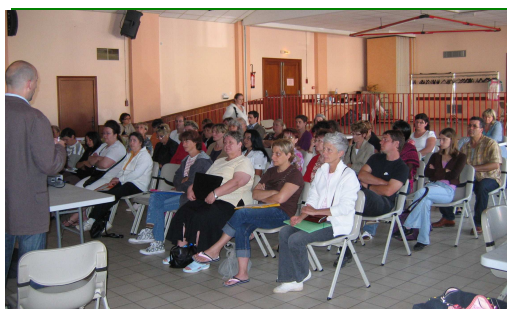
Métiers services à la personne - 2009