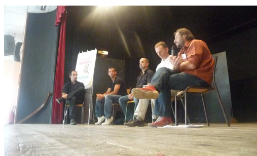
Eco-construction - 2010