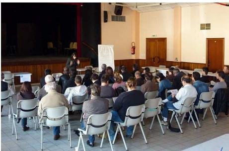
réunion J'Ose Dordogne - 2010

Cette action a permis de rendre le dispositif « création-reprise d'entreprise » plus lisible, d'apporter des réponses et de favoriser un guichet inter-consulaire.