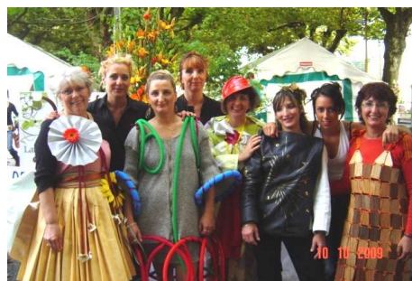
Artisans de Deux Mains - 2009

Cette manifestation, localisée à Lalinde, a mis en lumière les différents métiers de l'artisanat auprès des jeunes et du grand public (octobre 2007 et octobre 2009).