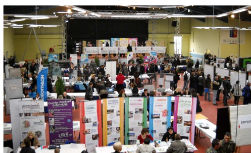
Forum de l'emploi - 2010